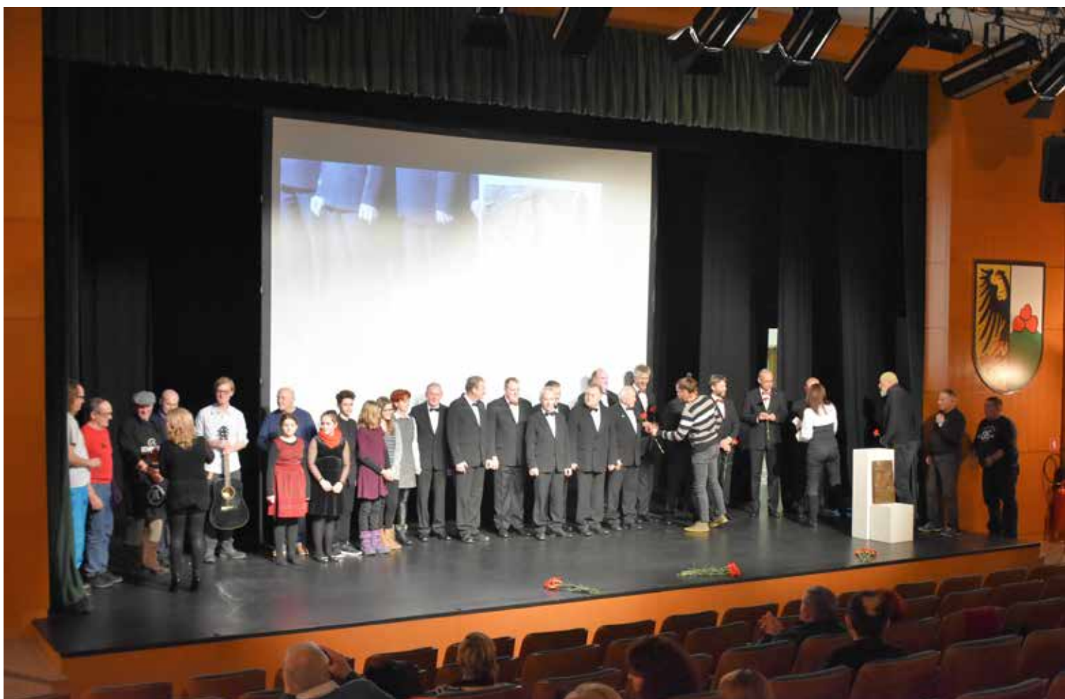
Naglej za vse nastopajoče in poklon publiki.