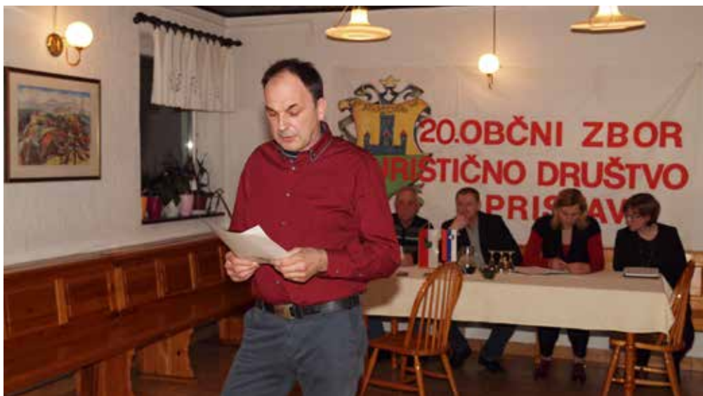
Občni zbor TD Pristava 2018

Predsednik je predstavil tudi plan dela za letošnje leto, kjer bosta tradicionalno glavni prireditvi prvomajsko srečanje na Pristavi in kuhanje oglja. Vetrolom, ki se je