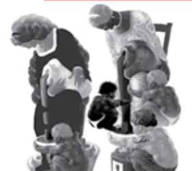
PRILOGA: List - kultura