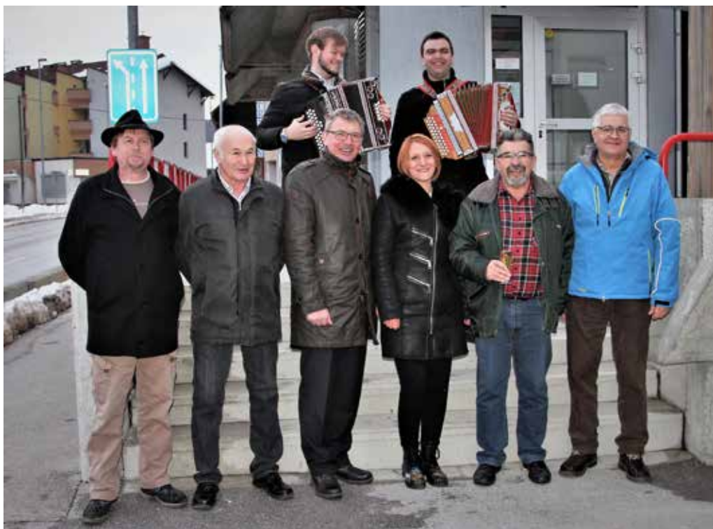
Rezači in gostje so se postavili za spominsko sliko.