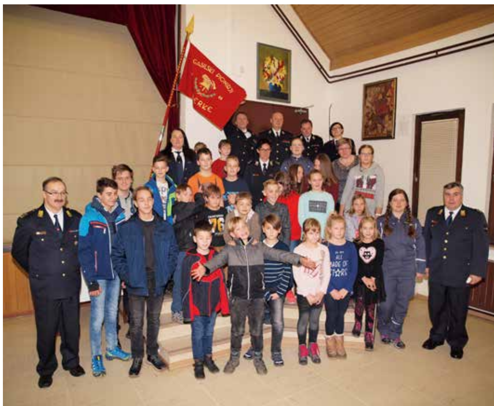
Mladina PGD Gaberke 2017