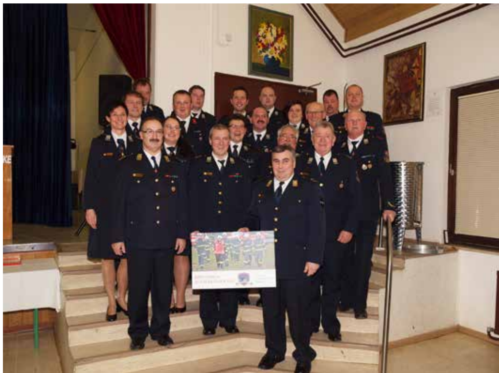
Novi in stari upravni odbor PGD Gaberke,

Gradu in iskanje pogrešane osebe. Opravili so tudi nekaj manjših akcij, kot so gašenje oglja na Pristavi, požarne straže, čiščenje zamašenih kanalov ter prevozi vode. Opravili so tudi veliko društvenih vaj, kjer so spoznavali vozila, opremo, vajo reševanja s čolnom ter podiranje drevesa v nevarnih okoliščinah. Na dan odprtih vrat, kjer so predstavili opremo, so povabili tudi PGD Šoštanj mesto s cisterno in PGD Topolšica z vozilom za gozdne požare. Na občinski vaji je bil opravljen prikaz gašenja z letalom Pilatus, kjer so bili zadolženi za varovanje vzletišča. Na področju izobraževanja so nekaj članov poslali na tečaj za uporabo IDA, na tečaj za uporabo velikih potopnih črpalk, delo z motorno žago, tečaj za gasilskega pripravnika, posvet sodnikov in mentorjev ter program intervencijske vožnje s simulatorjem Rosenbauer. Na različnih gasilskih tekmovanjih je nastopilo kar 14 desetih različnih kategorij, njihovi uspehi v obliki pokalov pa so bili razstavljeni na odru. Iz občinskega tekmovanja v Šmartnem ob Paki so prinesli štiri pokale in sicer članice A za 1. mesto, člani B za 1. in 2. mesto ter veteranke tretje mesto. Pokal so prejeli tudi za najštevilčnejšo udeležbo desetih na občinskem tekmovanju, saj se je v vseh kategorijah tekmovanja udeležilo kar 14. desetih. Veteranke so na regijskem tekmovanju osvojile 1. mesto in se s tem udeležile na državno tekmovanje, ki bo izvedeno letos. Uspešno so tekmovali tudi v Pokalnem tekmovanju za pokal GZS, kjer so osvojile 3. mesto.