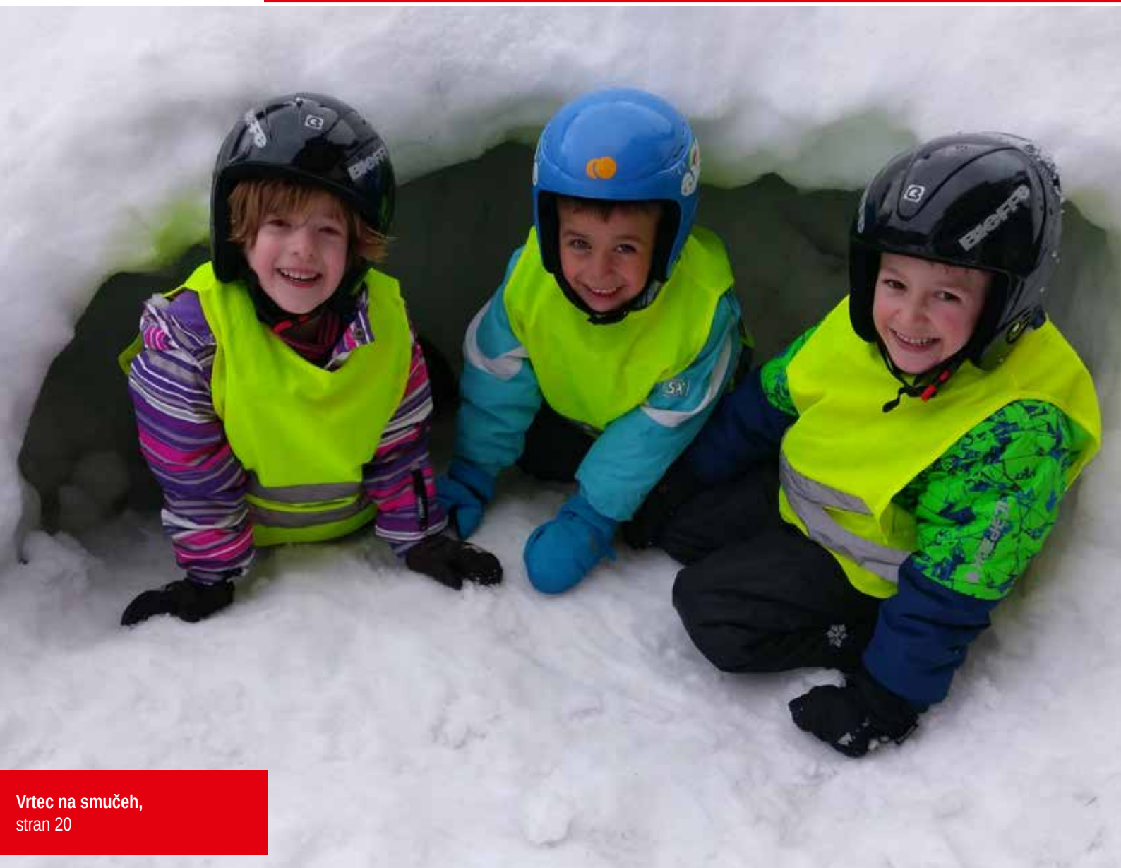
Vrtec na smučeh, stran 20