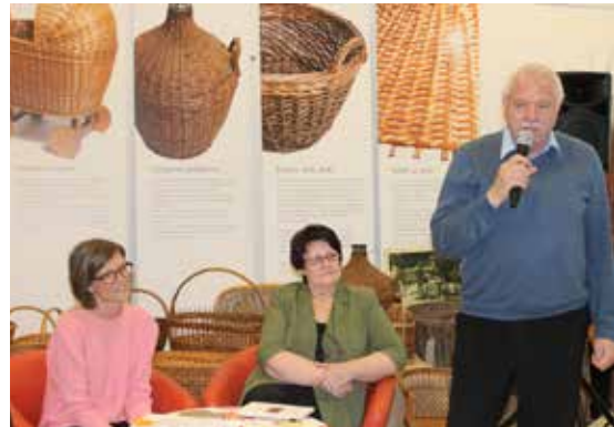
Utrinek z odprtja gostujoče pletarske razstave v DEOS Centru starejših Zimzelen Topolšica.