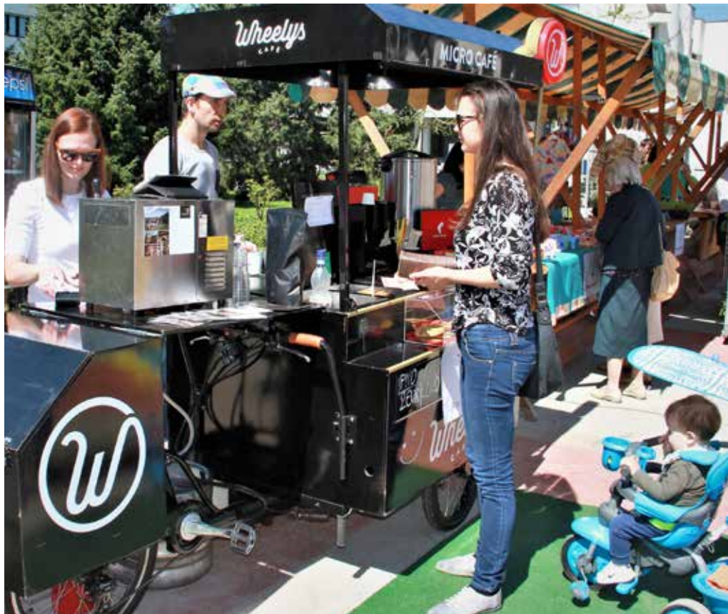
Dobrega sejma ni brez stojnice Micro cafe iz Šoštanja.