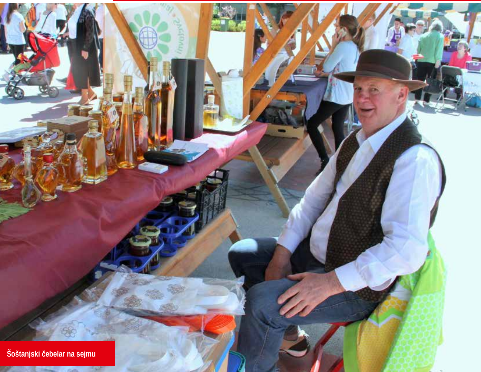
Šoštanjski čebelar na sejmu