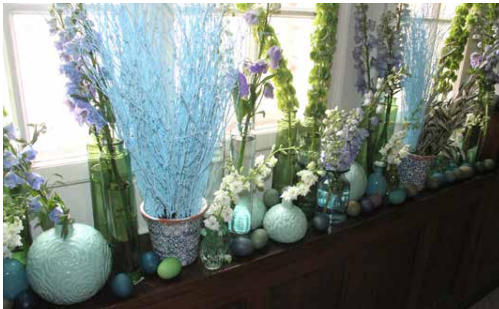
Velikonočna okenska polica v zelenomodrem.