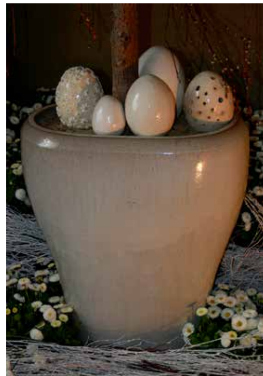
Keramični pirhi Gambatte.