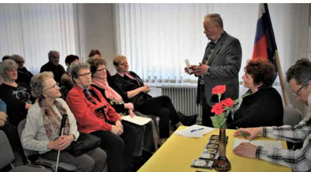
Starejši so pomemben del družbe in si zaslužijo več

V okviru projekta Sobivamo Ministrstvo za okolje in prostor skupaj s partnerji projekta v 11-ih mestnih občinah po vsej Sloveniji pripravlja dogodke, na katerih se predstavljajo modeli sobivanja, izkušnje in ideje, prav tako pa se zbirajo odzivi zainteresiranih. S predstavitvijo projekta je zaživela tudi spletna stran Sobivamo, razpravo s starejšimi in njihovimi svojci pa bo Ministrstvo za okolje in prostor spodbujalo tudi preko družbenih omrežij. V nadaljevanju projekta je predvidena še postavitve 11 informacijskih točk po Sloveniji. Partnerji projekta so še Ministrstvo za delo, družino, socialne zadeve in enake možnosti, Zveza društev upokojencev Slovenije (ZDUS), Stanovanjski sklad RS, Nepremičninski sklad pokojninskega in invalidskega zavarovanja ter združenja lokalnih skupnosti (Združenje mestnih občin Slovenije, Skupnost občin Slovenije in Združenje občin Slovenije).