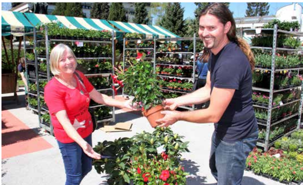
Na cvetličnem sejmu v Velenju se je predstavilo tudi Vrtnarstvo Potočnik.

Tako je bilo vso dopoldne, saj so bili obeti po poklonjenem cvetju za prvih 3.300 obiskovalcev dovolj velika dodatna privlačnost. Kot je dejal nekdo ... volitve so pred vrati, roža mor-da koga spomni, kdo jo je dal, ko bo zacvete-la. A so organizatorji kaj hitro zanikali, da bi bil to motiv – ni bilo prvič, ko so tisti zgodnji kupci in radovedneži dobili simpatično spodbudo za okrasitev svojih bivališč, teras in vrtov.