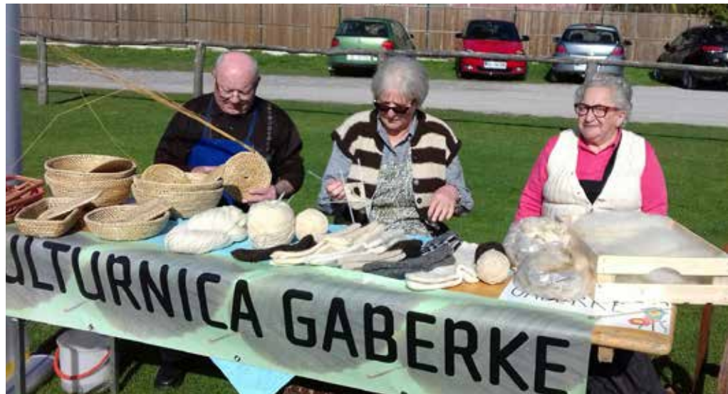
Šport špas Šoštanj 2018