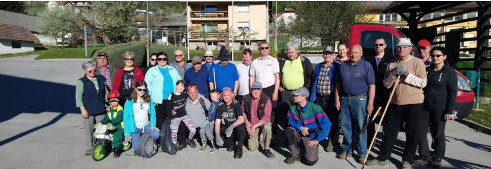
Čistilna akcija Gaberke 2018