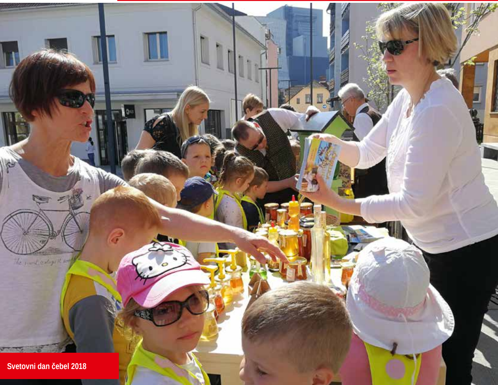
Svetovni dan čebel 2018