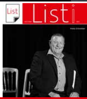
PRILOGA: List - kultura